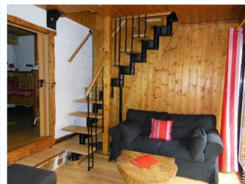
vista desde el cuarto de estar