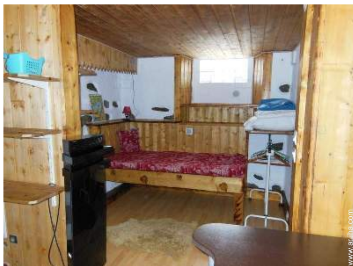
vista desde el cuarto de estar