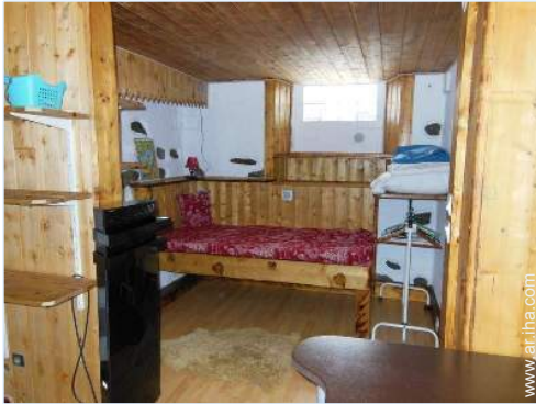
vista desde el cuarto de estar