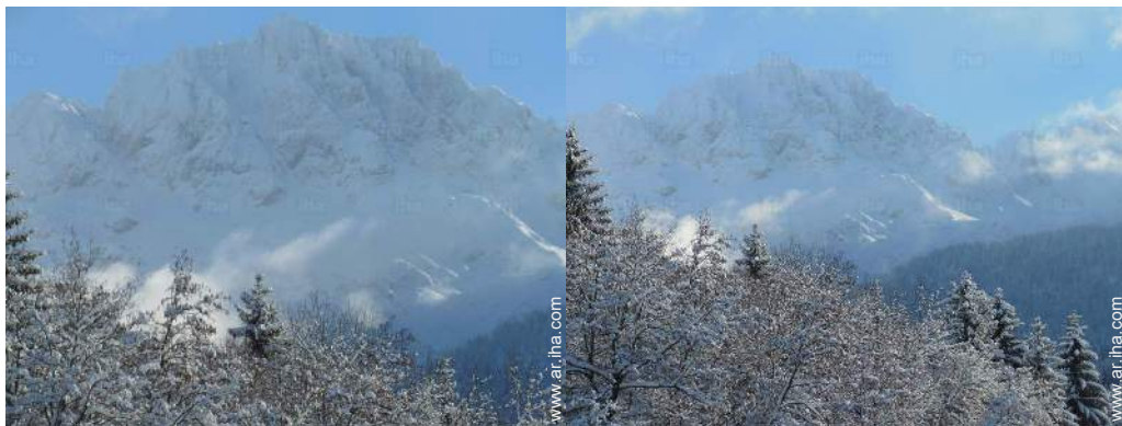
vista desde la casa