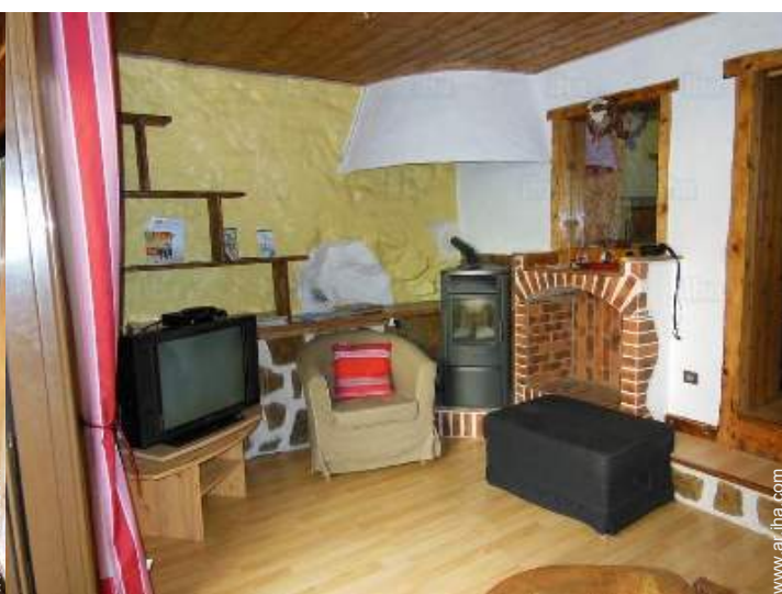
vista desde el cuarto de estar