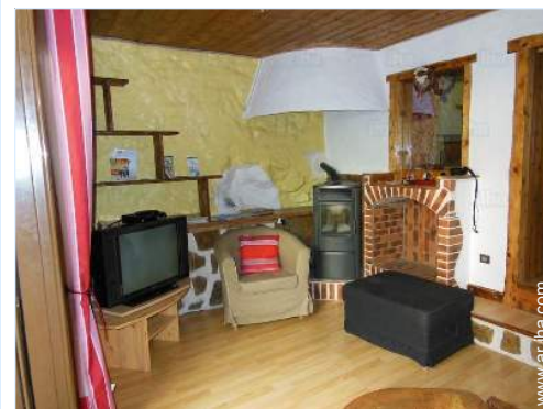
vista desde el cuarto de estar

Centro del pueblo 4km Alquiler de carro 10km Alquiler de equipo de esquí 15km Panadería 4km Pequeños comercios 4km Supermercado 10km Peluquería 10km Correos 10km Banco 10km Cajero automático 10km Farmacia 10km Doctor 15km Enfermera 10km Hospital 25km