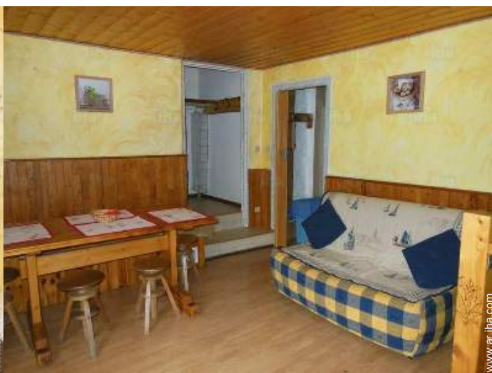
vista desde el balcón