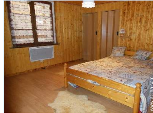
vista desde el apartamento