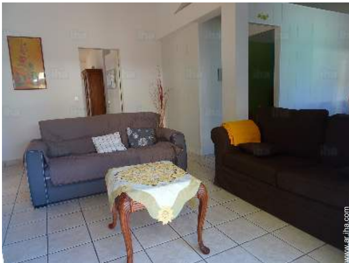
sofá cama 2 pers