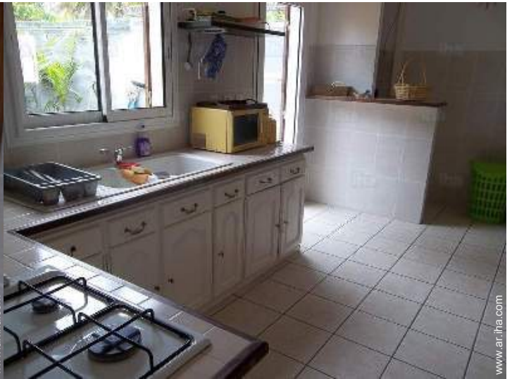
gran cocina independiente