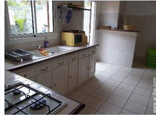
gran cocina independiente