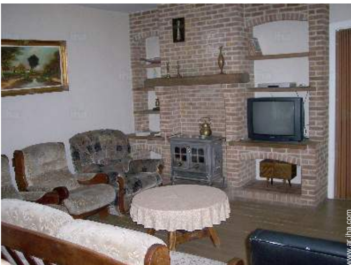
sala de televisión