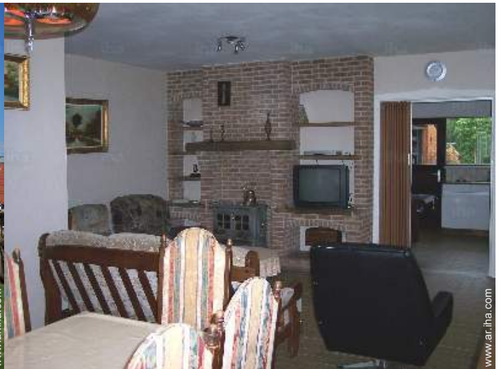
sala de televisión