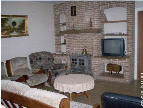
sala de televisión