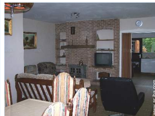
sala de televisión

Centro del pueblo 2km El centro 7,5km Parada/estación de guagua 2km Alquiler de bici/MTB 2km Alquiler de moto/escúter 2km Panadería 2km Catering 2km Pequeños comercios 2km Supermercado 2km Comercios de lujo y de marcas 7,5km Peluquería 2km Cibercafé 2km Correos 2km Banco 2km Cajero automático 2km Farmacia 2km Doctor 2km Hospital 7,5km