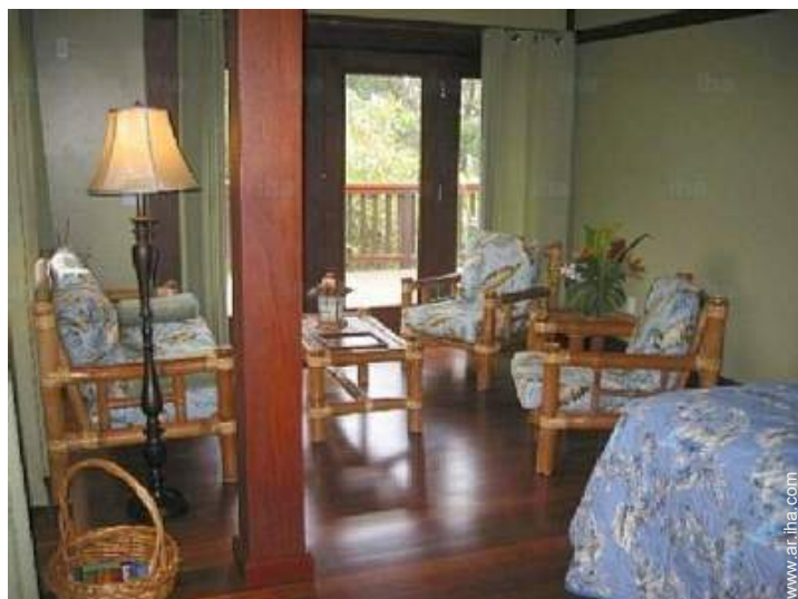
Disposición interior privado