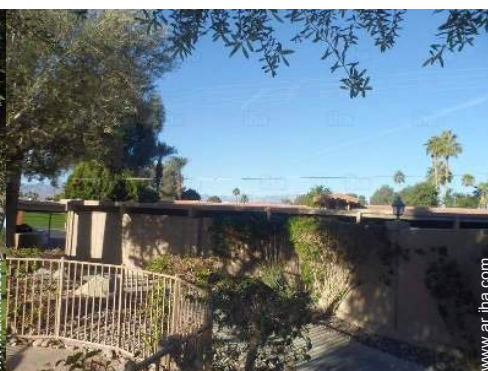
Instalaciones de ocio