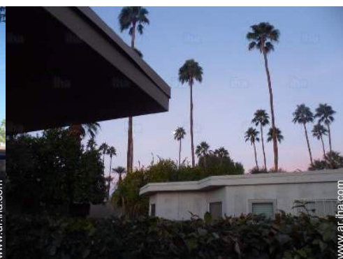
vista desde el patio