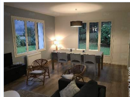
vista desde el salón

Mar/océano 800m Playa de arena 800m Piscina pública 15km Pista de tenis pública 2,5km Recorrido de golf 18 hoyos Base náutica Lago 2km Bosque 1,5km