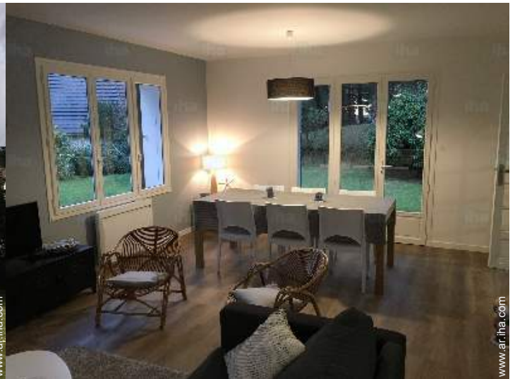
vista desde el salón