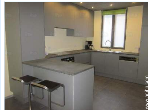
área de cocina

El centro <50m Tranvías 300m Panadería 100m Pequeños comercios 200m Supermercado 300m Cajero automático 300m Farmacia 300m