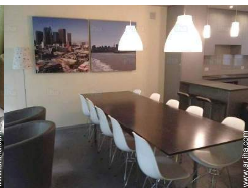
cuarto de estar