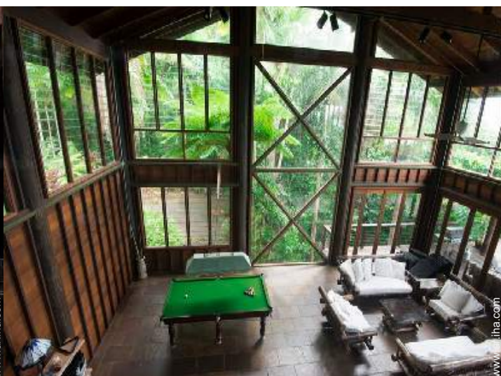
vista desde le entresuelo