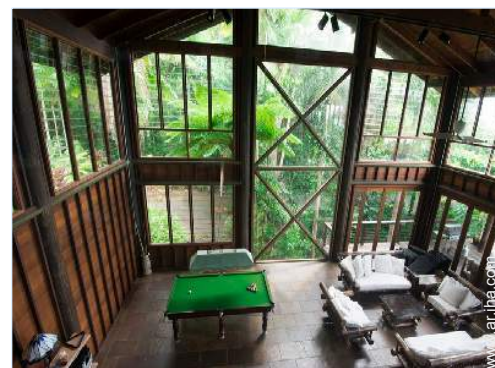
vista desde le entresuelo

Parrilla a gas, mesa con rodante, balancín