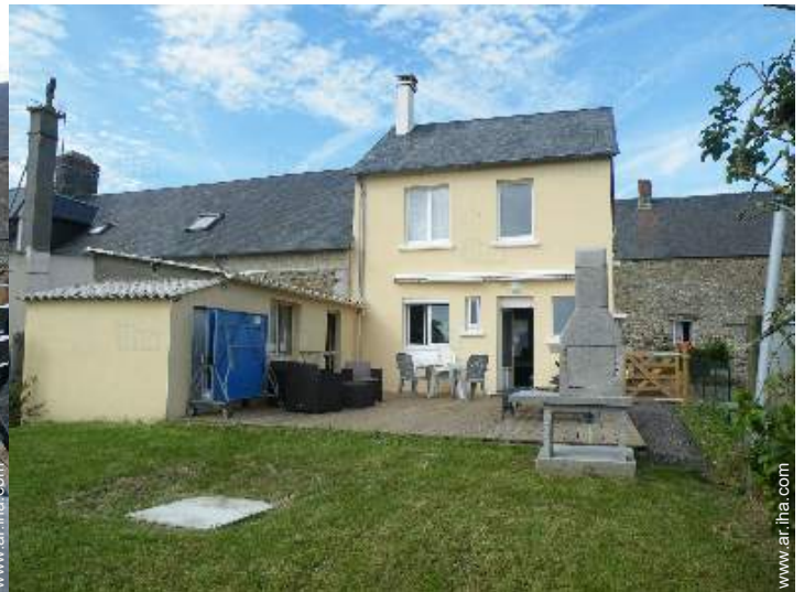
vista desde el jardín/parque