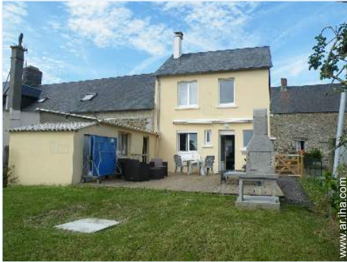
vista desde el jardín/parque