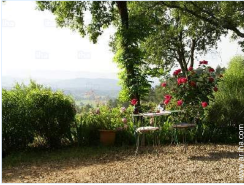
vista desde la casa