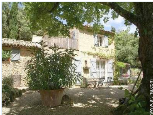
Propiedad con Encanto