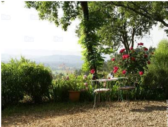
vista desde la casa