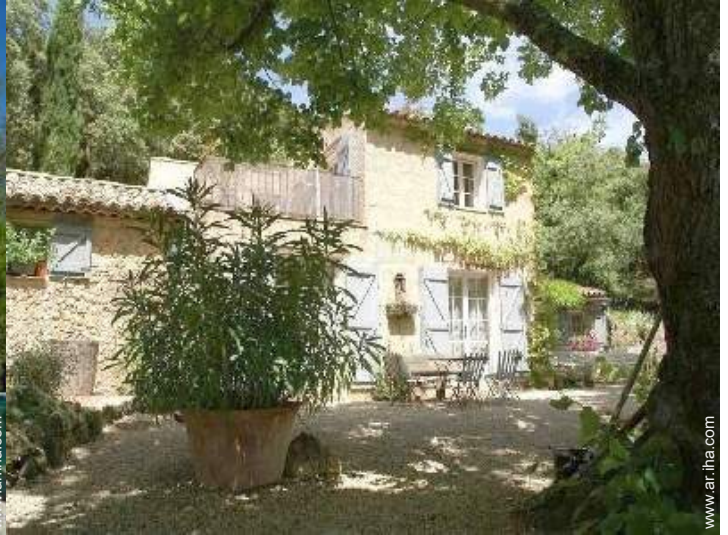
Propiedad con Encanto