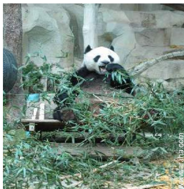
zoo/parque de animales