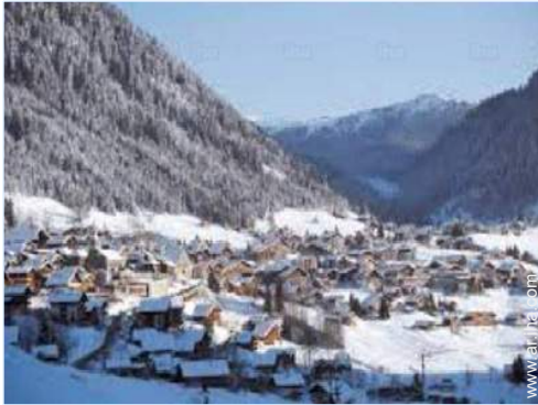
actividades de ocio invernales cercanas