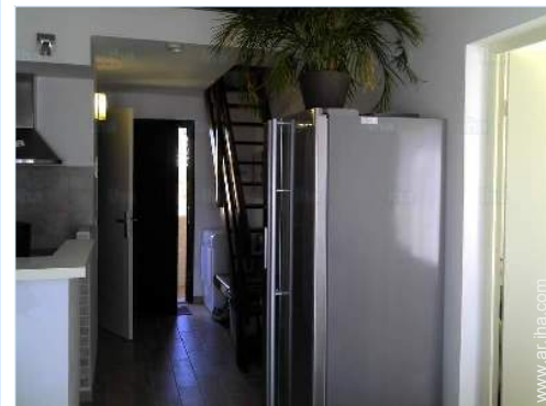
Disposición interior privado