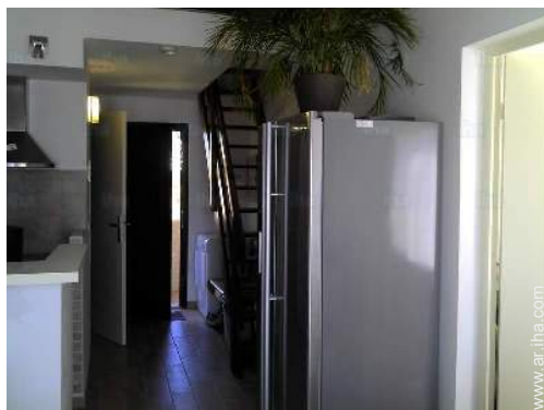
Disposición interior privado