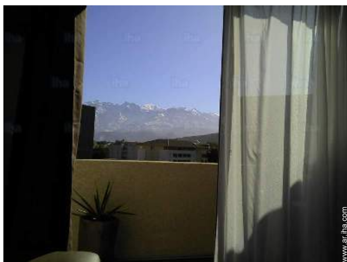
vista desde el apartamento