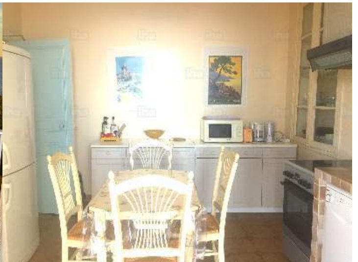
gran cocina independiente