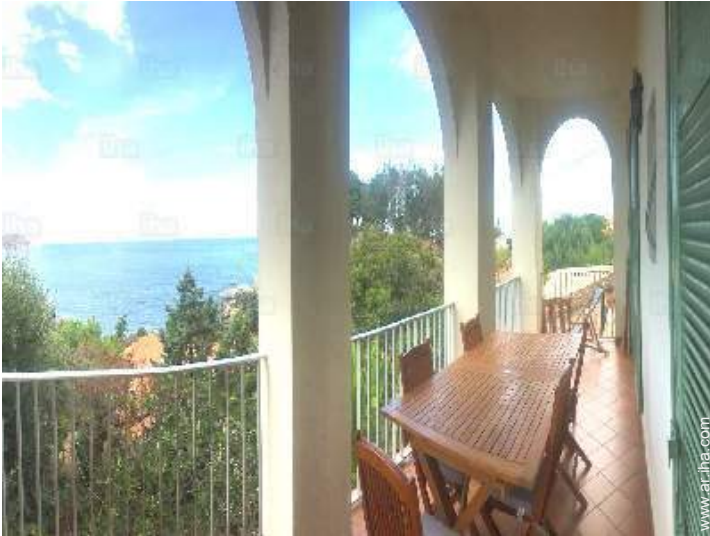
vista desde el balcón