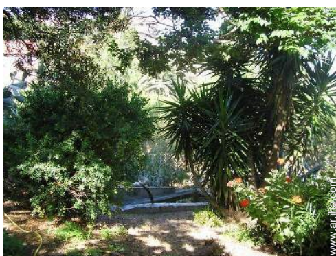
vista sobre el jardín/parque