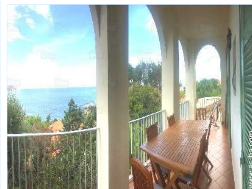
vista desde el balcón