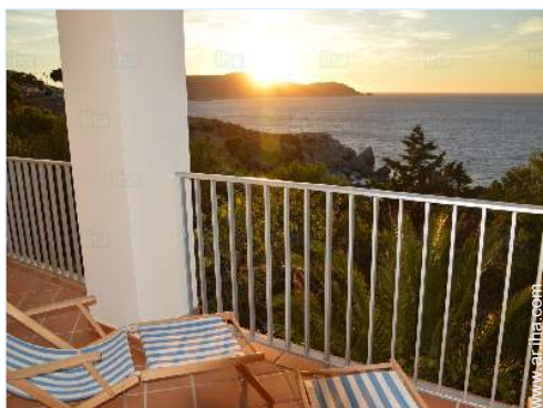
vista desde el balcón