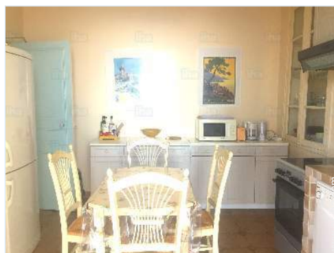
gran cocina independiente