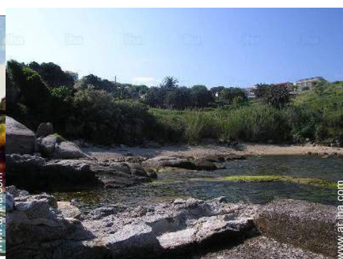
acceso directo playa