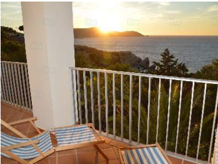
vista desde el balcón