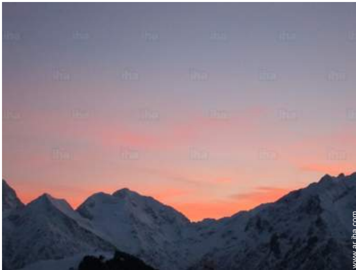
vista desde el apartamento