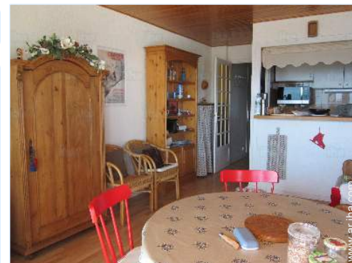
cuarto de estar