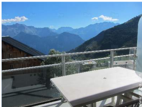
vista desde el apartamento