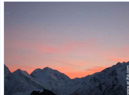
vista desde el apartamento