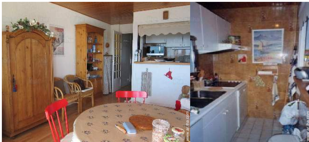
cuarto de estar