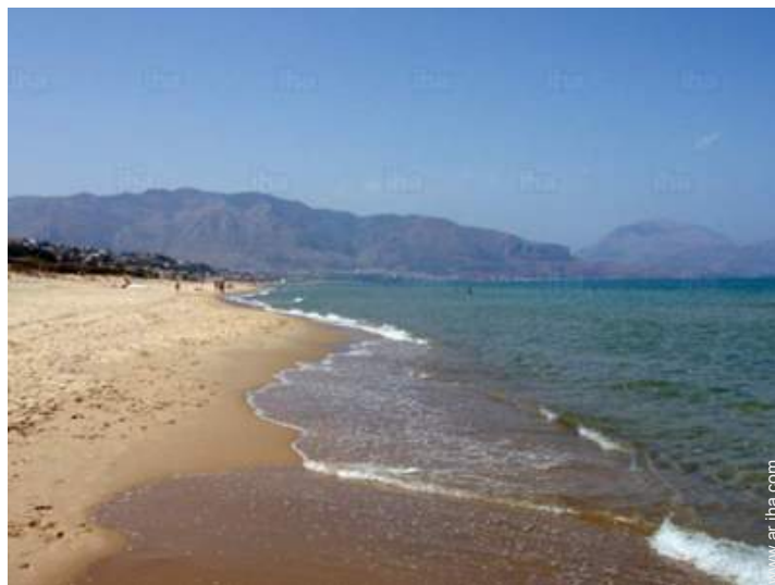
playa de arena