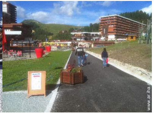
instalación de ocios