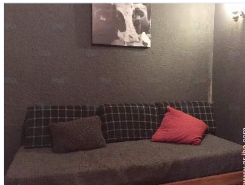
cama nido 1 pers