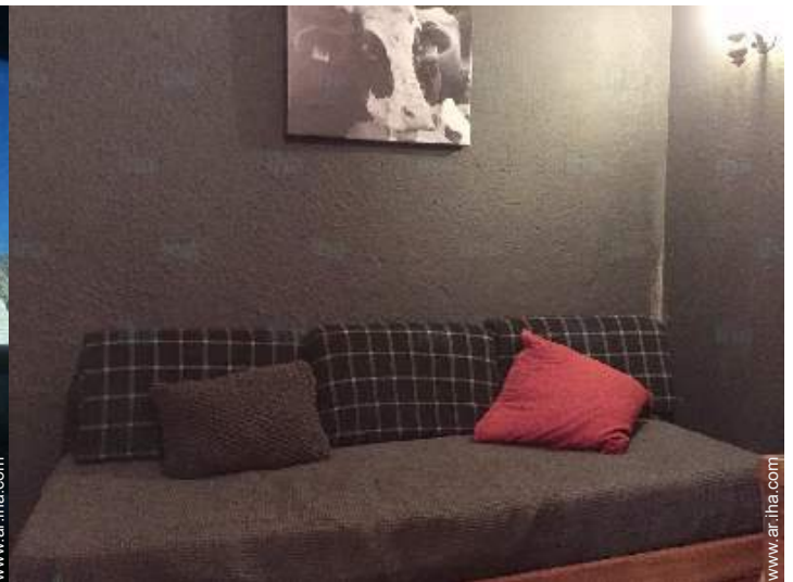
cama nido 1 pers