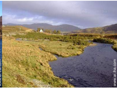
vista sobre el río