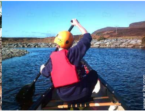
vista sobre el río