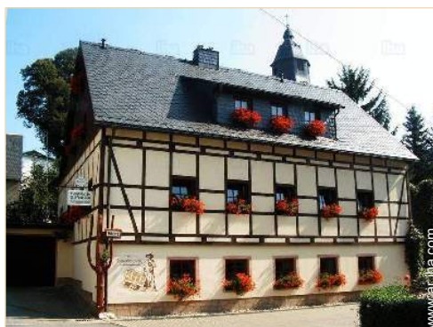
Casa con entramado de Lujo