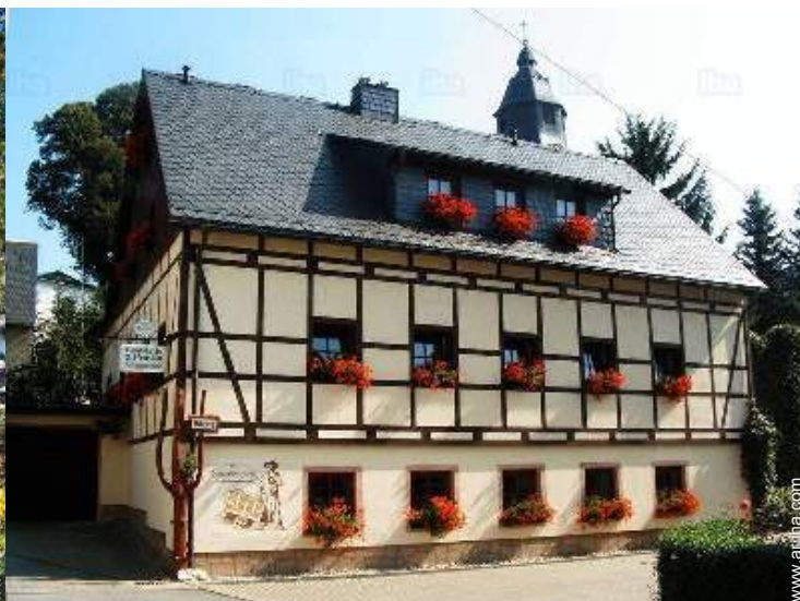
Casa con entramado de Lujo