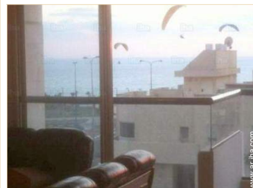
vista sobre el mar