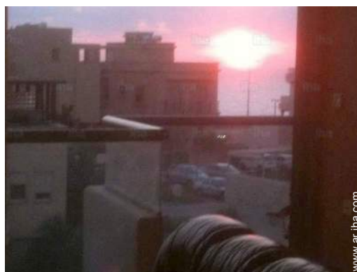
vista sobre el mar