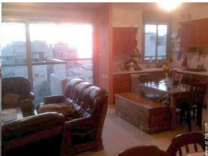
vista sobre el mar