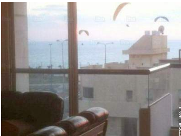
vista sobre el mar