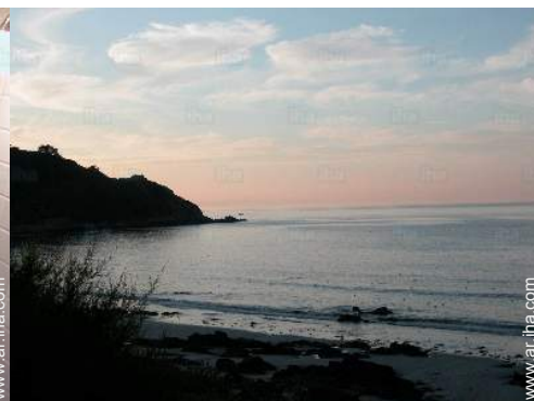
vista sobre la apuesta del sol