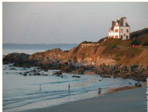
acceso directo playa