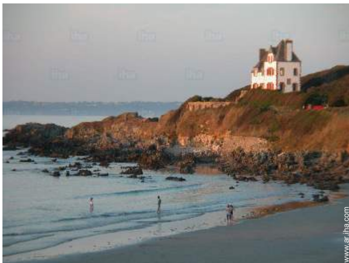
acceso directo playa