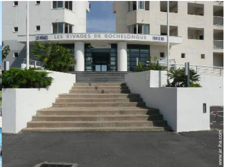
Residencia de lujo