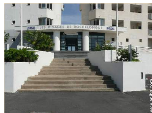
Residencia de lujo