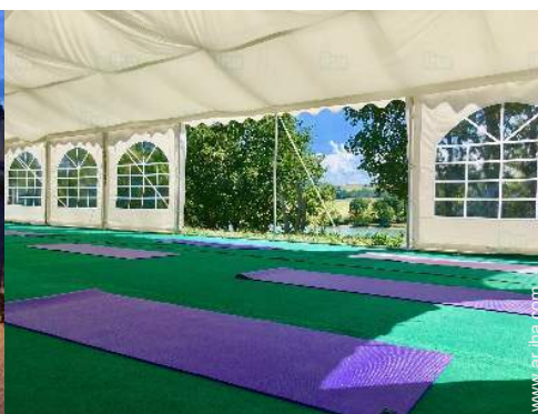
vista sobre el campo