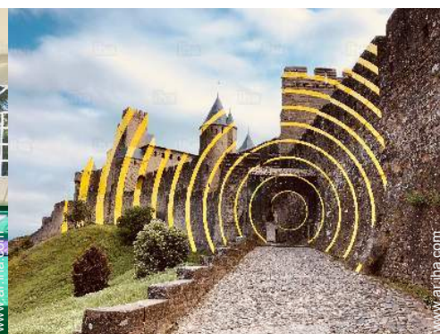
Zonas atractivas y relajación