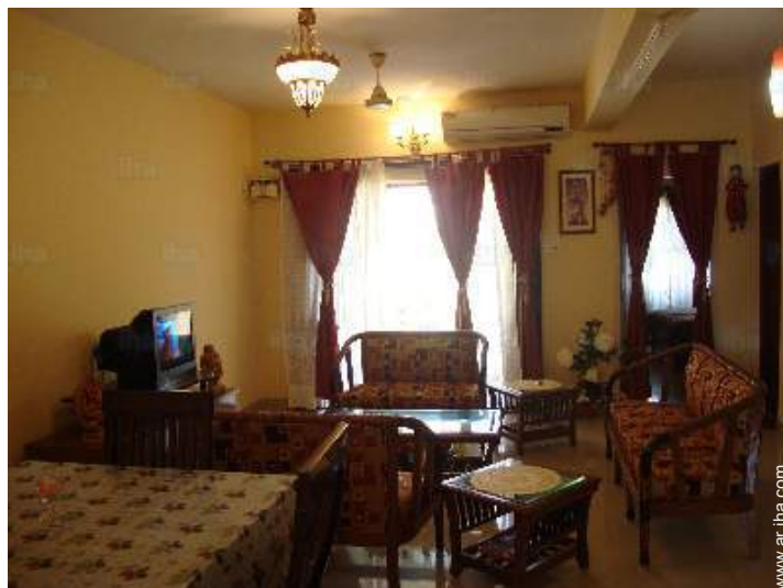
Propiedad de Lujo